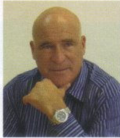
קוראים יקרים, למרות ש"קליבר קרבי" הוא מגזין היוצא לאור כל רבעון, קשה להימלט מהאקטואליה.

באיחולי קריאה נעימה ומהנה, רב-ניצב (בדימוס) אסף חפץ עורך ראשי